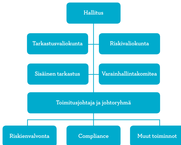
Kaavio: Keskusyhteisön riskienhallinnan organisaatio

Keskusyhteisön sisäinen tarkastus valvoo, että kaikkien Ryhmään ja Yhteenliittymään kuuluvien yhtiöiden sisäinen tarkastus on järjestetty asianmukaisesti. Keskusyhteisön sisäinen tarkastus varmistaa riippumattomalla toiminnallaan, että Keskusyhteisön hallituksella ja sen Tarkastusvaliokunnalla sekä toimivalla johdolla on käytettävissään oikeellinen ja kattava kuva Ryhmän ja Yhteenliittymän ja siihen kuuluvien eri yhtiöiden ja toimintojen kannattavuudesta, tehokkuudesta, sisäisen valvonnan tilasta ja erityyppisistä toimintaan liittyvistä riskeistä.